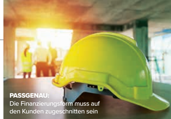
PASSGENAU: Die Finanzierungsform muss auf den Kunden zugeschnitten sein

Um die Stärken und Schwächen der Anbieter näher zu beleuchten, definierten die Fachleute fünf Fairness-Kategorien und ordneten ihnen die Attribute zu. Für jeden Bereich ermittelten sie anschließend eine Teilnote. Unter Berücksichtigung der